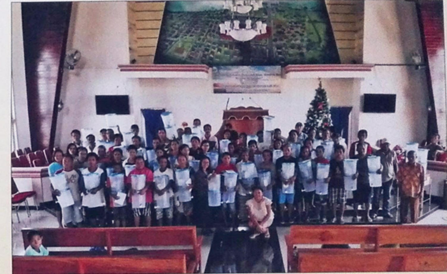
In de kerk van Haria.

'Als je je bangsa of satu kampung wil helpen, doe het gewoon! En doe dit met liefde, in alle nederigheid en leg alles neer bij de Heer. Er zijn geen tricks hiervoor. Het is een kwestie van ideeën bedenken, uitzetten en proberen mensen te raken met de boodschap die je hebt voor het project. We proberen zoveel mogelijk mensen, ook de Harianezen in Nederland te bereiken en te helpen door bijvoorbeeld inzamelingsacties op te zetten. We vinden het belangrijk dat met name zij zich betrokken voelen bij dit project. Alles valt en staat met een gunfactor. Verder is het hard werken,